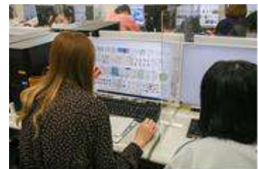
△流行りの LINE スタンプを調べる学生

摂津市と摂津市商工会が、摂津市内の事業所等で生産・製造・加工され一定の基準を満たす優れた商品等を「摂津優品」として認定しており、この「摂津優品」ブランドを広く PR できるデザイン。