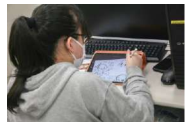
△デザインを描きはじめる学生

摂津市の新しい顔として期待される千里丘駅西地区の再開発事業（令和9年完成予定）を市内外の人に広く知ってもらえるようなデザイン。