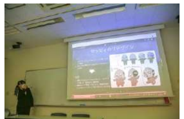
△最終プレゼンテーションの様子

摂津市の公式マスコットキャラクターである「セッピー」を使った今までにはないデザイン。（セッピーのスタンプはすでに1セットあるので、新しいデザイン）