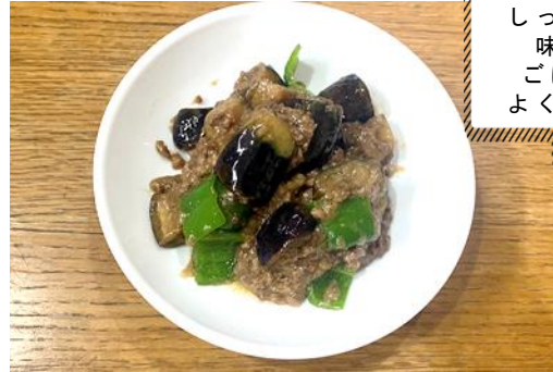
水なすの味噌炒め

調理中の酵素反応により味噌の旨味成分(グルタミン酸)の一部を GABA に変え、 1食 注1 中の GABA は調理前に比べ 1.8~2.5 倍に増加。60~90mg 程度の GABA を摂ることができます。