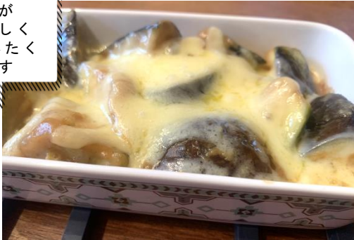
水なすの味噌漬けグラタン