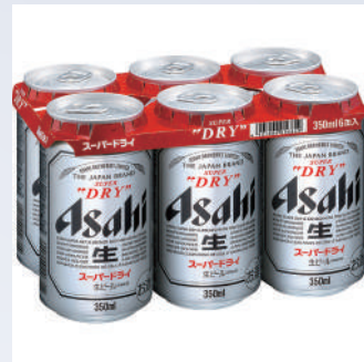
銅賞・特別審査員賞(花澤裕二) / ウエストロック株式会社 エコパック