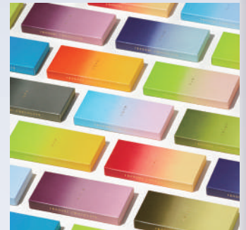
特別審査員賞(辻愛沙子) / Study and Design IRODORI CHOCOLATE