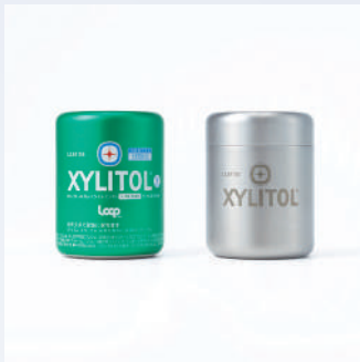
金賞・特別審査員賞(太刀川英輔) / 株式会社ロッテ Loopキシリトールガム