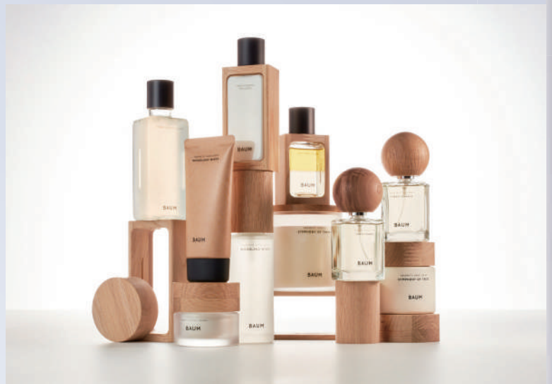
大賞/資生堂クリエイティブ(株) BAUM

「日本パッケージデザイン大賞」は、公益社団法人日本パッケージデザイン協会主催のコンペティション事業として隔年に開催されます。パッケージというデザイン領域のプロフェッショナルたちが集い、公募により広く作品を募集して選考する、デザイン性や創造性を競うコンペティションです。「日本パッケージデザイン大賞2023」は、応募総数1060点を数えました。59名の一次審査員による第一次審査において、416点の入選作品が選ばれ、第二次審査においては協会会員審査員10名に、前回大賞受賞者1名および外部特別審査員4名を加えた二次審査員15名の討議にて、合計31点の入賞作品を決定いたしました。本展では大賞に輝いた「資生堂 BAUM」をはじめ、金賞7点、銀賞12点、銅賞10点、特別審査員賞4点を含めた入賞作品を展示いたします。「今」を代表する最新のパッケージを是非ご覧ください。