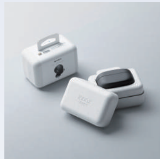
金賞・特別審査員賞(左合ひとみ) / ソニーグループ株式会社 オリジナルブレンドマテリアル [WV-1000XM4]パッケージ