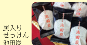
炭入りせっけん池田炭