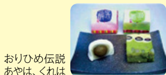
おりひめ伝説あやは、くれは

池田市のイメージを象徴する物語性や話題性を含む「池田らしい」「池田ならではの」の魅力あふれる商品について、認定審査会が審査し、池田市長が認定したものを「池田ブランド認定品」と定めています。※現在の認定品は6品(下記写真はそこから4点掲載)。新認定品も募集しています。