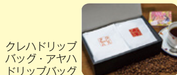
クレハドリップバッグ・アヤドリップバッグ