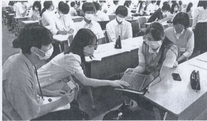
大学生とビジネスプランの意見交換をする高校生ら。吹田市

商業を学ぶ高校生が、大学の連携授業でビジネスプランを作成したり、地元企業と協働で新商品を開発したりする取り組みが広がっている。実践的なビジネスを学校教育の場に取り入れることで専門性を高め、円滑なキャリア形成を図っていくのが狙い。枠組みを超えた多様な教育連携の動きが今後加速しそうだ。