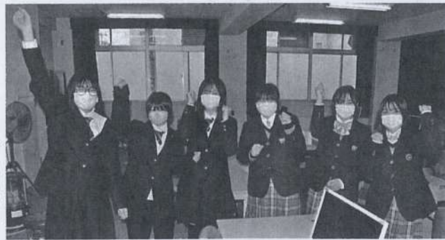
コンペイトーの商品開発に取り組んだ府立住吉商業高校と大商学部の生徒たち。大阪住之江区

府立大阪ビジネスフロンティア高校(大阪市天王寺区)では昨年夏、グローバルビジネス科の2年生が関西大学千里山キャンパス(吹田市)で高大連携授業として行われた交流会に参加。SDGs(持続可能な開発目標)の課題解決をテーマに同大商学部とのゼミ生約40人と意見を交わした。