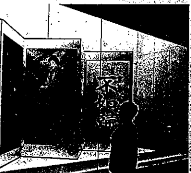
人気絵師らが描いた「不如帰」の芝居絵を屏風に仕立てた作品も並ぶ「あやし絵展」(大阪市中央区)