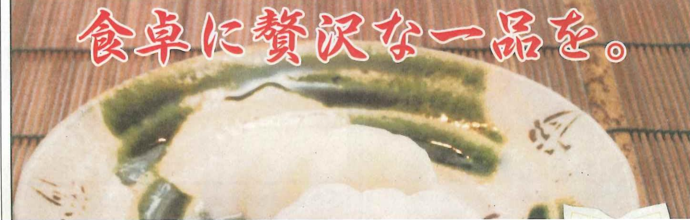
食卓に贅沢な一品を。