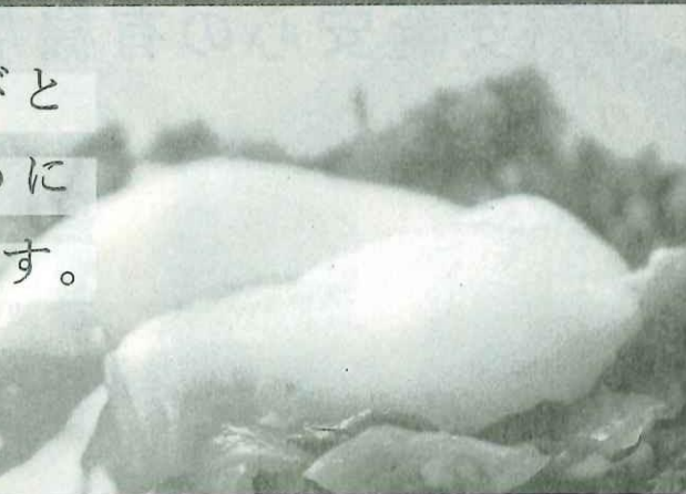
びとめになります。

は、予定通り行う。県委託事業「あいちの野菜と漬物の魅力発信事業」について今年度は東海漬物(株)が担当し、来年1月、キャベツをテーマとして一般市民に講演を行う。さらに来年度までに更新