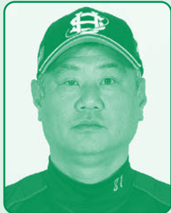
成本 年秀 監督

プロ野球独立リーグ オセアン滋賀ユニテッドベースボールクラブ選手と 一緒に遊ぼう!