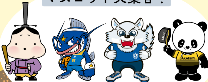
大津市観光キャラクター おおつ光くん 滋賀レイクス マグニー 大学公式マスコット ひらやん サカイ引越センター まごころパンダ