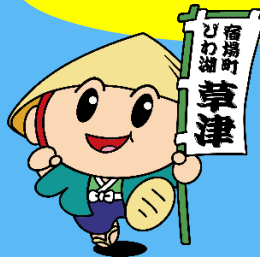
草津市公認 マスコットキャラクター 「たび丸」