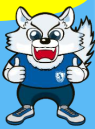
びわこ成蹊スポーツ大学 公式マスコットキャラクター 「ひらやん」