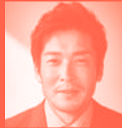
元サッカー日本代表 かじ あきら 加地 亮